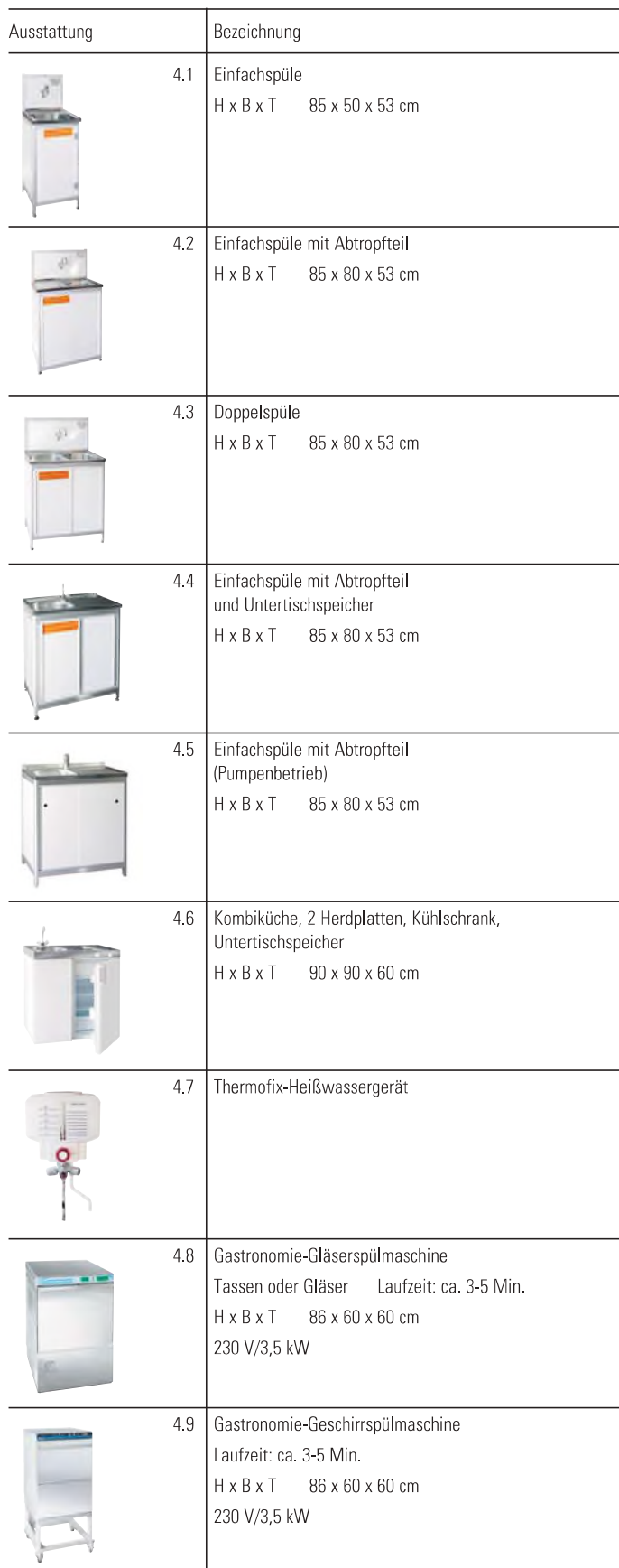
Illustration der Mietgeräte